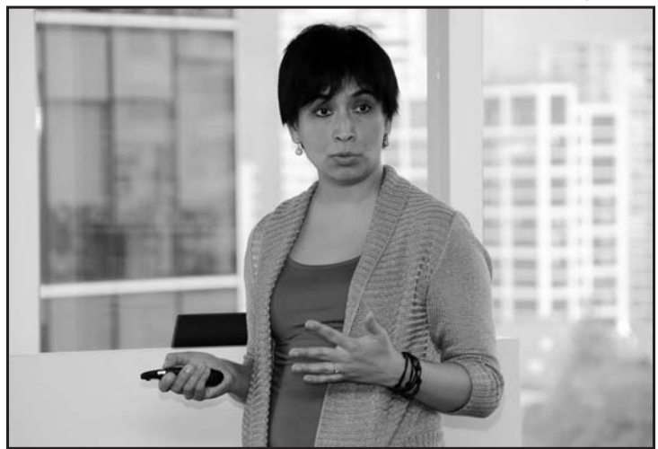
Martes 27 de octubre Cuidados Paliativos en Pediatría EU Chery Palma