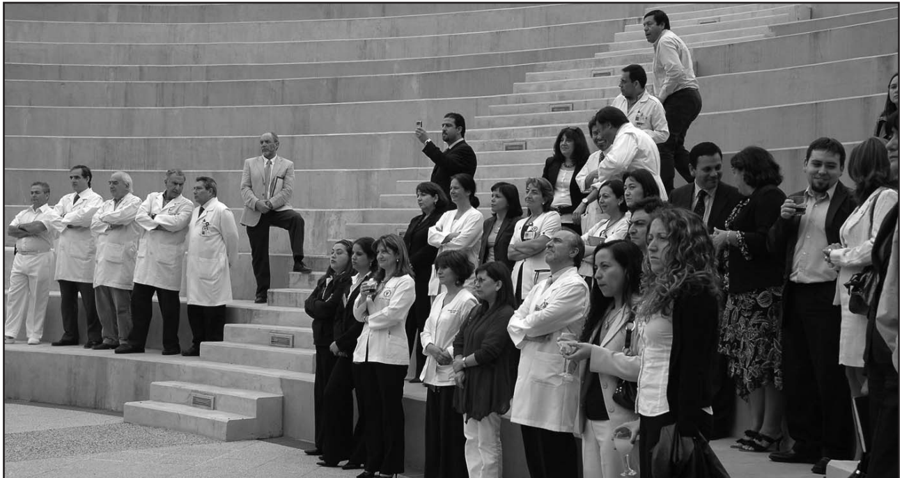
Los asistentes disfrutaron de un cocktail mientras escuchaban conocidas arias de ópera, a cargo de integrantes del Coro del Teatro Municipal.