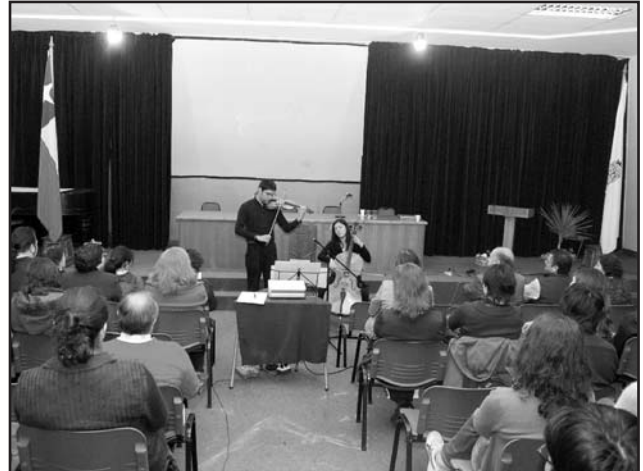
Un conjunto de cuerdas aportó un espacio para el arte y la cultura en la Jornadas de Dolor Coquimbo 2009.

La presencia de la ACHED a través de su Grupo de Interés de Paliativos conforma, desde su nacimiento, una alianza estratégica con el programa ministerial, que ha contribuido en forma importante al desarrollo de la temática de cuidados y control de síntomas en el paciente terminal.