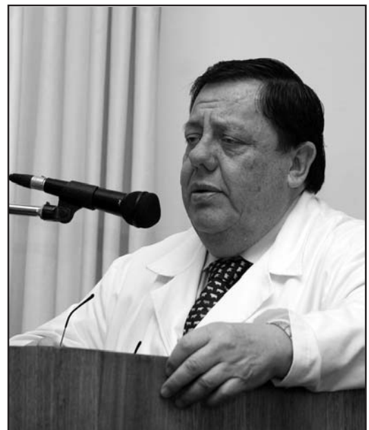
Un importante número de profesionales de la salud participó activamente de las Jornadas de Capacitación SSMO.