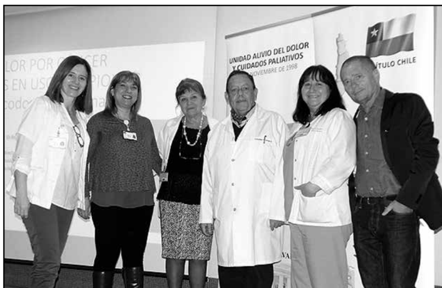
Equipo docente XIII Jornadas Capacitación en Dolor y Cuidados Paliativos PSF - HDS

Un número importante de inscriptos correspondió a integrantes de Atención Primaria, con los cuales la Unidad del Hospital del Salvador mantiene un estrecho vínculo de coordinación para la atención de los usuarios. De esta forma, se concluyó un año más de colaboración en el contexto de la alianza estratégica establecida entre ambas entidades respecto de aliviar el sufrimiento de los pacientes con cáncer avanzado, como también de sus familiares.